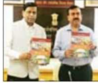
पुस्तक का विमोचन करते खाद्य एवं सार्वजनिक वितरण सचिव।