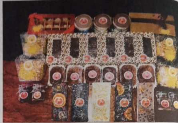
Confectionary items developed using jaggery by the NSI